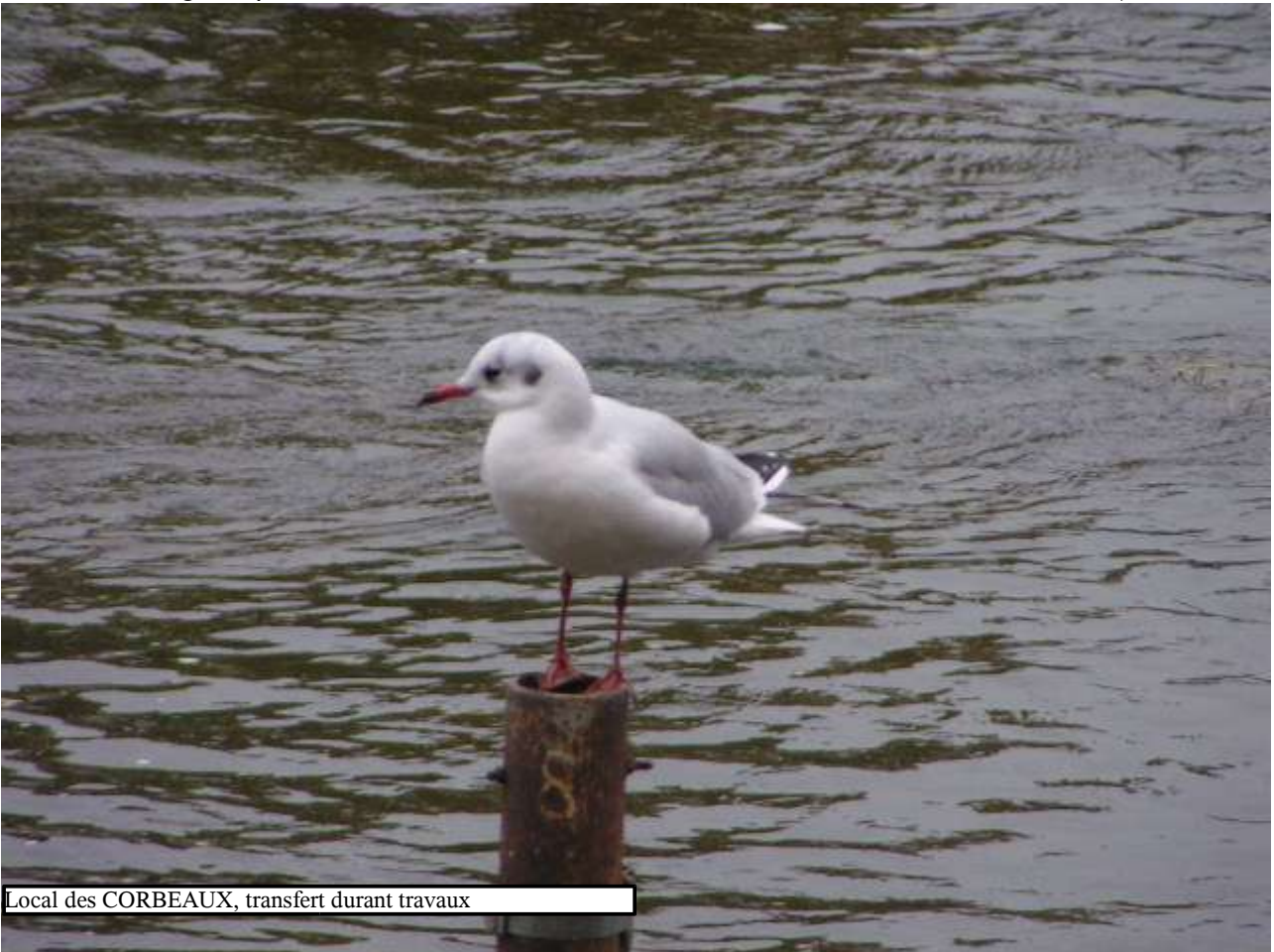
Local des CORBEAUX, transfert durant travaux

Association agréée par le ministère de l'environnement au titre de l'article 40 de la loi du 10 juillet 1976